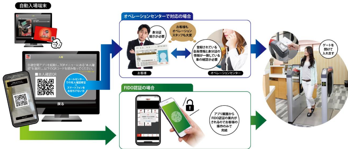
セルフ店舗システムでの FIDO 認証利用イメージ