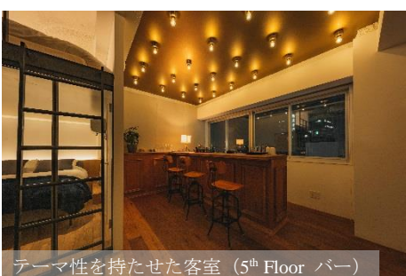
テーマ性を持たせた客室 (5 th Floor バー)