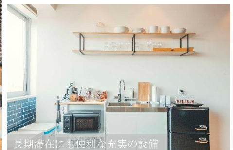
長期滞在にも便利な充実の設備