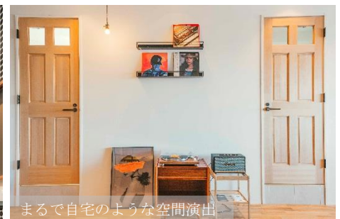
まるで自宅のような空間演出