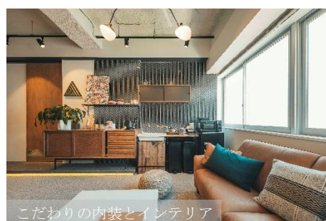
こだわりの内装とインテリア