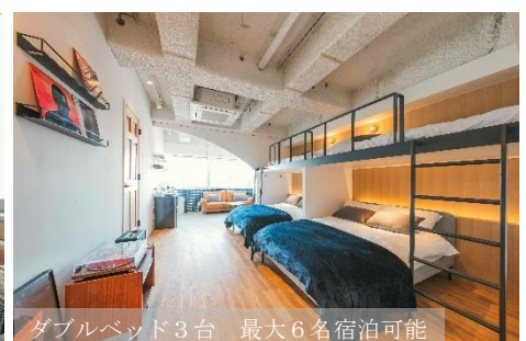
ダブルベッド3台 最大6名宿泊可能