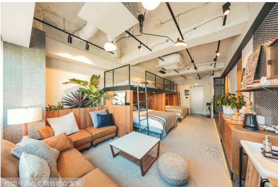
仕切りがなく開放的な客室

【スリープオーバーエクスペリエンス】と冠する「illi Shimokitazawa」は、約 50 ㎡の空間にあえて仕切りを設けず、コミュニケーションをより活性化させるテーマをもたせた客室で構成しており、旅先でも我が家のように友人との気兼ねない「お泊まり会 (スリープオーバー)」のような居心地のよさを感じていただけるような空間づくりにこだわりました。