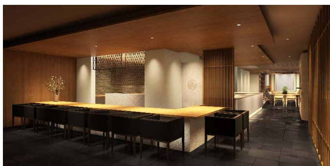
1階レストラン イメージ画像