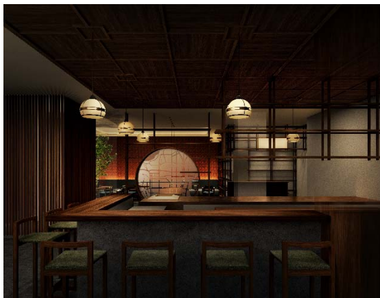
宿泊者専用ラウンジ兼バー イメージ画像