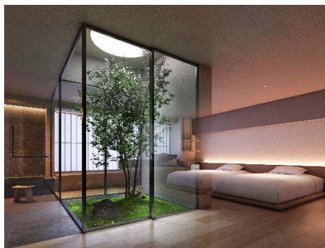
客室 イメージ画像