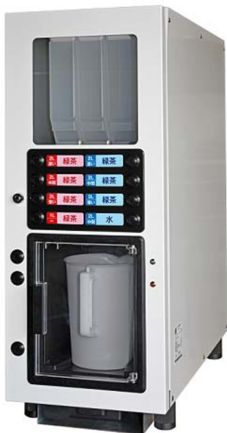
アペックスの「とろみ自動調理サーバー」 W:300mm D:650mm H:726mm (脚の高さ含まず)