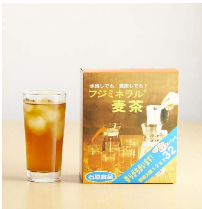
石垣食品の「フジミネラル麦茶」