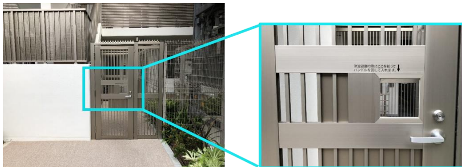
本件の屋上避難階段入口（1階北側）

○POINT3：永続的な設備維持の為、行政と提携。藤沢市の公的制度活用。分譲マンションとしては初の取り組み。