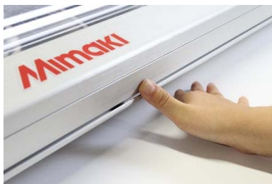
フルレングススイッチ

「AT Series」を導入し、作業安全性の確保及び効率的な作業環境を整えることで、働き方改革の一助としてご活用いただけます。