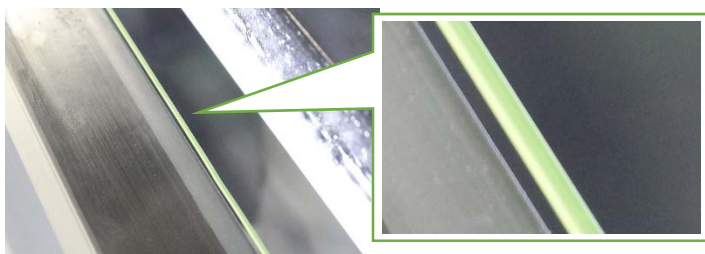
トリミング位置ガイドスロット

トリミングの位置合わせはユニット内に設置されているガイドスロット(糸)で簡単に行えます。さらにユニット内には LED ライトが内蔵されており、正確な位置合わせにお役立ていただけます。