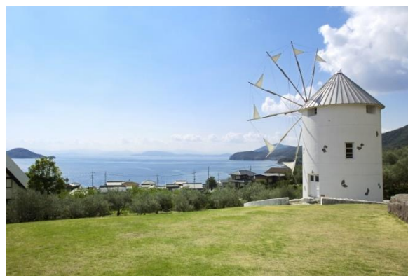
(小豆島：オリーブ公園)