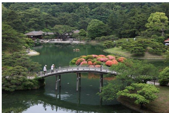
(高松市内：栗林公園)