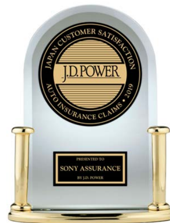
2019年自動車保険事故対応満足度調査 第1位のトロフィー

※ J.D. パワーの調査の概要やソニー損保と業界平均との差異、ソニー損保の事故解決サービスにおける近年の主な取組みについては、2ページ目をご参照ください。