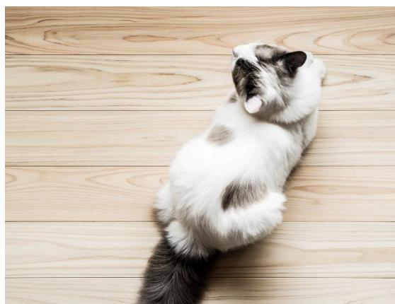
▲《NEKOFLOOR》 ヒノキ 節なし