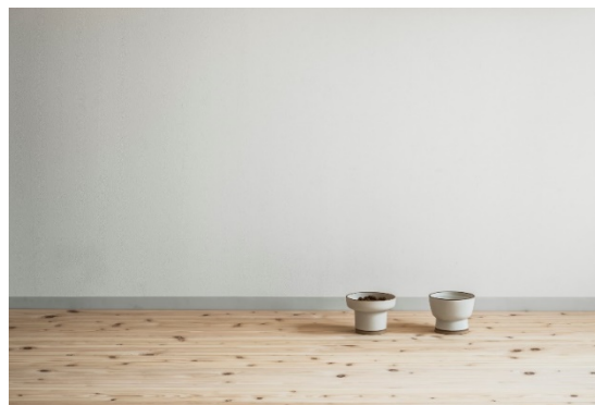
▲上から「NEKOFLOOR」ヒノキ 節なし、節あり