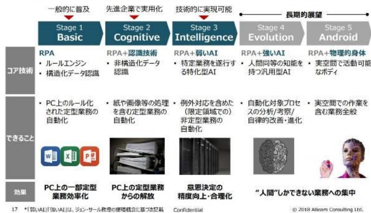
RPA の高度化のステップ

RPA単体(Stage 1)は既に普及期 今後は周辺技術との連携により、次世代型デジタルレイバーへの進化が加速する