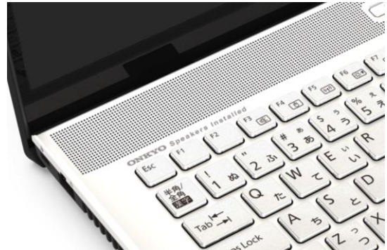
ONKYO Speaker Installed

FMV LIFEBOOK NH シリーズは、リビングでの利用に最適な 17.3 型の大画面液晶を搭載した PC です。HDMI 入力端子搭載によりセカンドディスプレイとしても利用でき、ゲーム機やスマートフォンを接続して画面を映写できます。大画面をより楽しんでいただくために、低域を強化した新規開発のスピーカーボックスが搭載されており、迫力のある低音を実現しています。また、音響補正アプリケーション「Dirac Audio」が搭載されており、スピーカーユニットに最適化された音楽、映画などコンテンツに応じた臨場感がお楽しみいただけるようになっています。