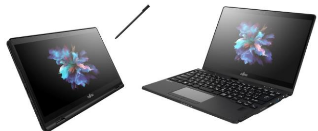
LIFEBOOK UH シリーズ

また、同時に発売される FMV LIFEBOOK UH シリーズは、ビジネスシーンでのモビリティを追求した軽量モデルで、移動先でのプレゼンなどでも活用できる高音質スピーカーが採用されています。