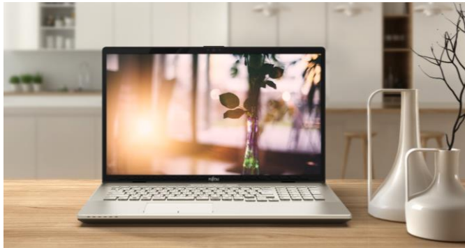
LIFEBOOK NH シリーズ

オンキヨー株式会社は、7月18日より順次発売される富士通クライアントコンピューティング株式会社（神奈川県川崎市、以下「FCCL」）の個人向けノートパソコン FMV「LIFEBOOK NH シリーズ」と「UH シリーズ」に、当社製スピーカーユニットが搭載されましたことをお知らせいたします。