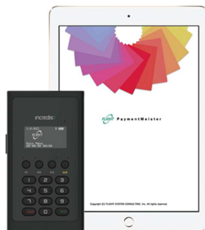
Incredist Premium・ペイメント・マイスター (イメージ)

この度亀の井バス様では、今後大きなキャッシュレス決済の需要が見込まれる高速バスのチケット販売窓口において、フライトシステムの決済端末「Incredist Premium」および「ペイメント・マイスター」を導入いただきました。すでにチケット販売窓口ではNEC製のiPad POSを導入しており、同POSとアプリケーション連携が自動で出来る決済ソリューションを導入いただくことで、