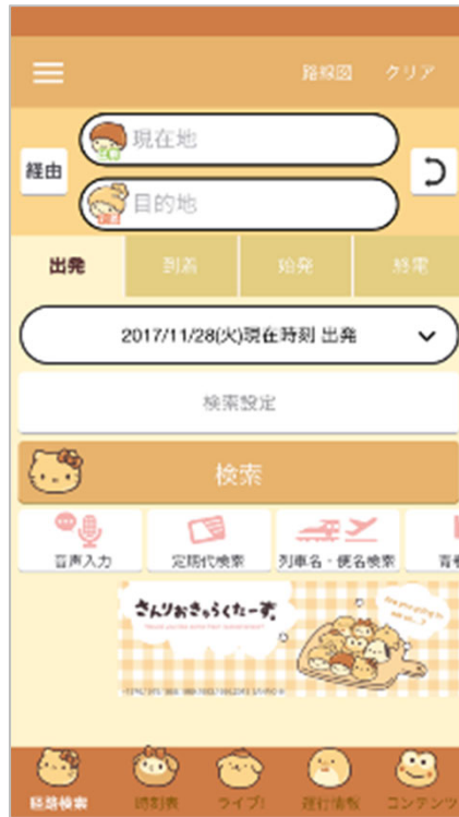
サンリオキャラクターズ ちぎりぱん