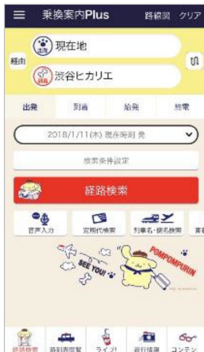
ポムポムプリン おでかけ