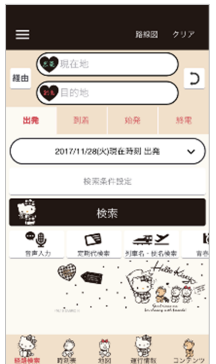
ハローキティ トラベル