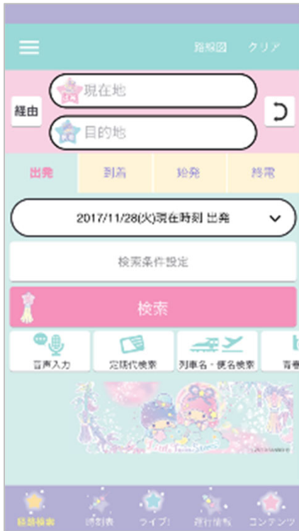
リトルツインスターズ 七夕

リトルツインスターズの七夕デザインをはじめ、iOS版「乗換案内」でもコラボテーマの配信を開始します。第一弾は以下のテーマを含め、全8種です。ラインナップは随時更新されます。