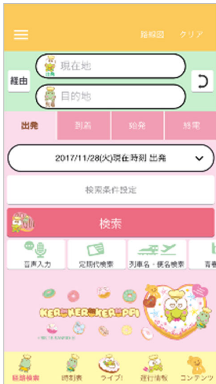
けろけろけろっぴ ドーナツ