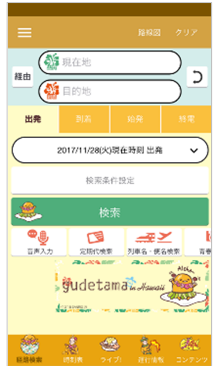
ぐでたま ハワイアン