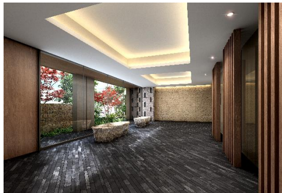
エントランスホール完成予想図（※1）