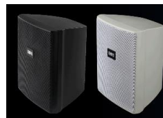
業務用スピーカーシステム

このように、当社グループでは、祖業であるスピーカー開発で培ってきた音に関する技術を活用し、OEM 事業において「Sound by Onkyo」などサブブランド戦略を強化しております。すでにホーム A V 機器の 3 倍以上の出荷台数を達成して、オンキヨーブランドの露出拡大を行っております。今後もあらゆる場面において高品位な“音”のソリューションの提供を続けるとともに、さらなるブランド向上を目指してまいります。