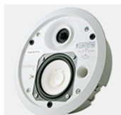
インシーリングスピーカー

当社 OEM 事業においては車やテレビ用の小型スピーカーユニット以外にも、これまでにインシーリング（埋め込み）スピーカーや各種業務用スピーカーシステムの設計を行っており、当社のスピーカー技術やノウハウを業務用音響機器に活用しております。今後もあらゆる使用用途に適した音のソリューションを提供することで、業務用音響機器分野での市場拡大を目指してまいります。