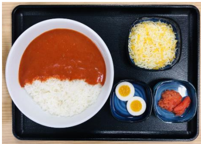
赤カレーと具材が提供