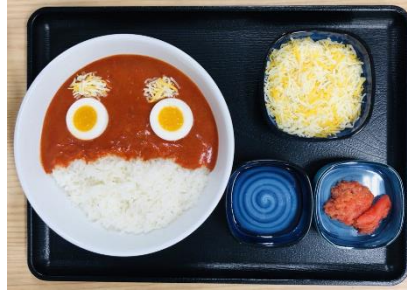
具材をお好みにトッピング