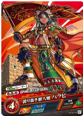
誇り高き獣人姫ハクビ

キャンペーン期間中、「オラゴンカレー」をご注文でモンカード限定 PR カード「誇り高き獣人姫ハクビ」、「モンスター盛」をご注文でモンスターアニメ「ルシファー（神化）」ステッカーをプレゼントします。どちらも数量限定のため、お早めにゲットしてください。