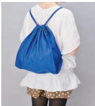
クルリト デイリーリュックバッグ