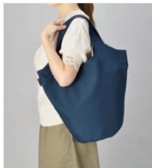
クルリト マルシェバッグ