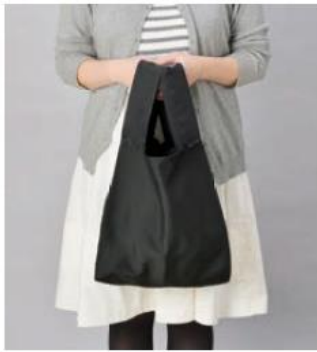
クルリト デイリーバッグ