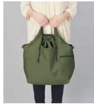
クルリト ビッグマルシェバッグ