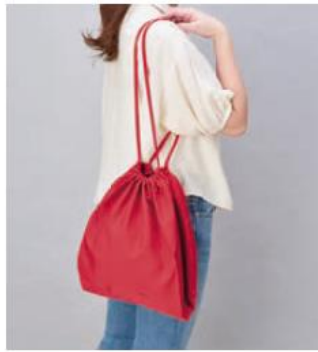
クルリト デイリー巾着バッグ