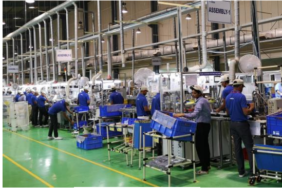
インド工場生産ライン

当社は、当社 OEM 事業の主要生産拠点となるインド工場において、好調に拡大する受注に対応し、昨年度比約 3 倍となる、月産 50～60 万台体制に向け、生産ラインを拡大してまいります。