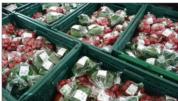
3.加工作業完了しました