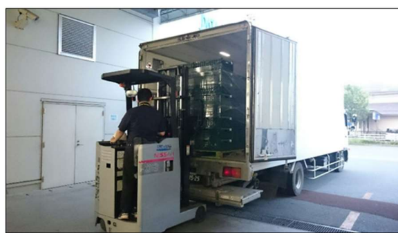
4.関西のスーパーマーケットに出発します