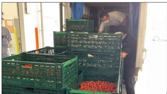
1.鳥栖センターに野菜が到着しました