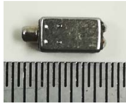
【バランスド・アーマチュアドライバー】