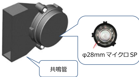
【小型高音圧スピーカーモジュール】

当社はホームAV事業売却により、祖業であるスピーカーコンポーネント事業への回帰を進め、OEM事業に注力することによってあらゆる用途への拡大と業績向上を目指してまいります。