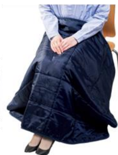
【厚手スムースフリースレギュラーブランケット】