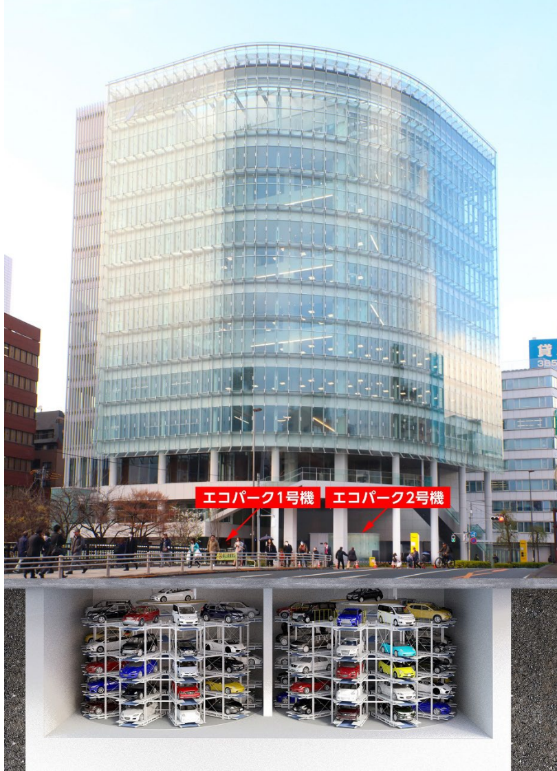
品川区西五反田に建設されたパーク24株式会社の新本社ビル。 地下空間に100台の車両を収容