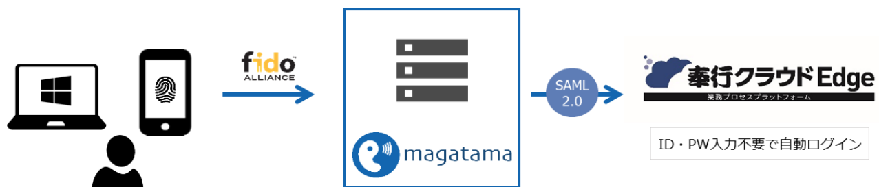
マガタマサービスと奉行クラウド Edge 連携イメージ

「マガタマサービス」「奉行クラウド Edge」両製品の連携により、利用者がスマートフォンやタブレット上で指紋認証を行うだけで安全に「奉行クラウド Edge」にログインできます。これにより、勤怠管理・給与明細・年末調整申告などの業務に素早く取り組むことができ、従業員およびバックオフィス部門の柔軟な働き方を支援します。働き方改革で従業員ひとりひとりの生産性向上がますます求められるなか、両製品を販売パートナーを通じて販売し、導入企業の働き方改革への取り組みをサポートしてまいります。