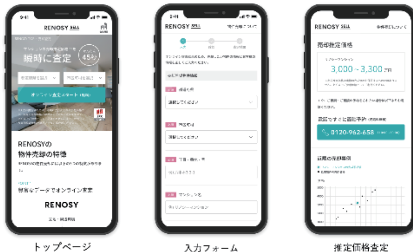
< 図 : RENOSY SELL の UI >