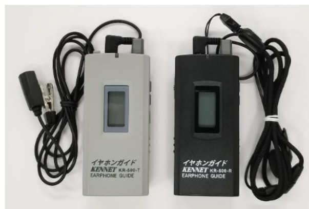
イヤホンガイド KR-500 (左)送信機 (右)受信機