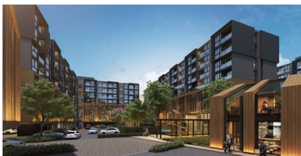
The Excel Hideaway Sukhumvit 50