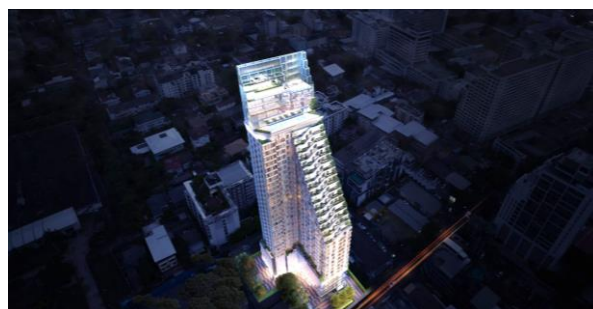
Rise Phahon - Inthamara