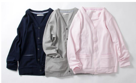
↑ポップコーンVカーディガン

これらは全国の「ikka」店舗、公式オンラインストアなどのWEBストアにてお問い合わせいただけます。