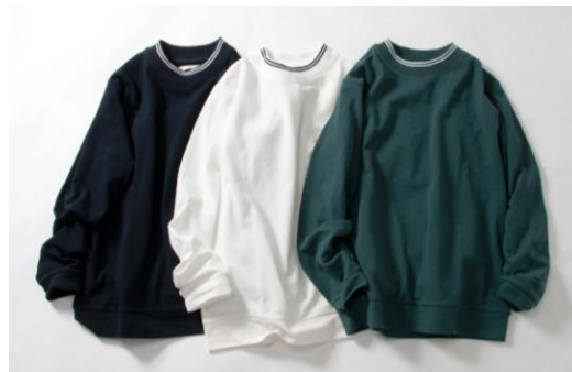
↑リブラインハイネックTシャツ

コックスはこれからも、一日も早い東北の復興と発展を願い、ファッションを通じた支援活動を継続してまいります。