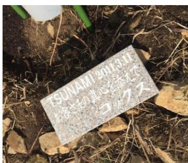
↑苗木の傍に置く石板