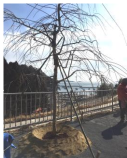
↑シンボルツリーの桜

昼食会では、餅つきや地元の方から牡蠣汁が振舞われ、その地ならではの食事に心も温まりました。参加した従業員からは「地元の方に地震当時の話を聞け、同時に今の被災地を自分の目で見ることができ、貴重な体験となった」「また機会があれば参加したい」などの声が聞かれました。