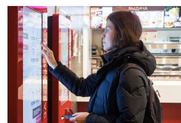
上：VP6800 イメージ、 下：自動精算機利用イメージ