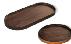
Gli Oggetti- Zhuang