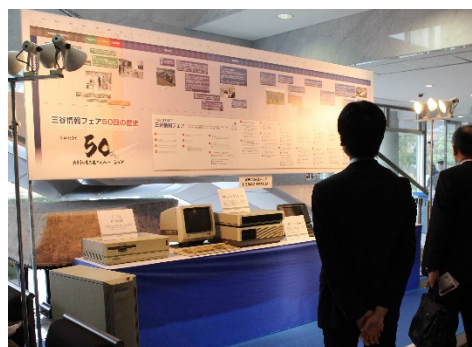
情報フェア50回の歴史を紹介するパネル

「三谷情報フェア」は1993年以来、北陸・金沢で25年に渡り、普段触ることができないICTに関する最新のソリューションやセミナーを、企業の情報システム担当の皆様や一般の皆様に触れていただく場として、毎年7月と12月に開催しています。第50回となる今回は、「共創が生み出すイノベーション」をテーマに掲げました。ICT、IoT、AIなどの技術の発展とともに複雑化する現代社会においてイノベーションを生み出していくために重要な、分野や企業の壁を越えたコラボレーションによる「共創」の誘発を図りました。