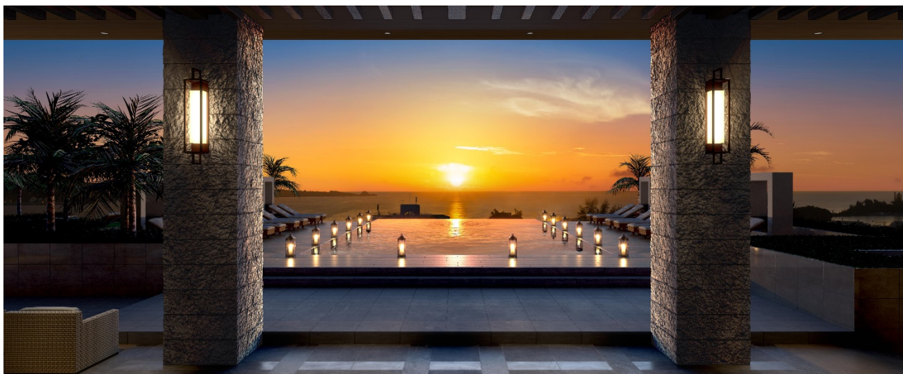
オープンエアエントランスから望むインフィニティビューテラス（完成予想CG）

本プロジェクトは「沖縄日和～心晴れやかにくつろぐ、特別なリゾート時間を～」をコンセプトに、恩納村において那覇空港から一番近い西海岸リゾートホテルとして、どこよりも“沖縄日和”を謳歌できる、幸せのリゾートを目指しております。