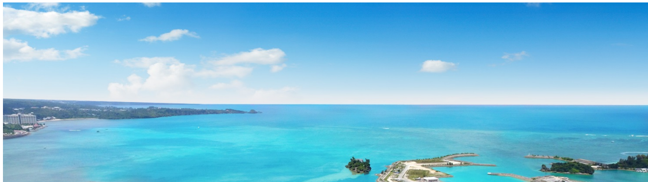
現地 12 階相当からの眺め（2018 年 8 月撮影）

また、民間調査機関によると、沖縄県の来訪者は2017年度に957万人と、ハワイの938万人を超え、直近の5年間における来訪者数の増加率平均は10.3%。さらに、2020年には那覇空港第二滑走路の増設が予定されており、今後も国内のみならず海外観光客の来訪増加が見込まれ、東アジアの中心に位置する立地の良さからも、拡大するインバウンド観光で着実な成長が期待されています。