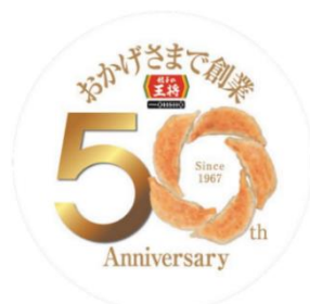
創業50周年ロゴマーク