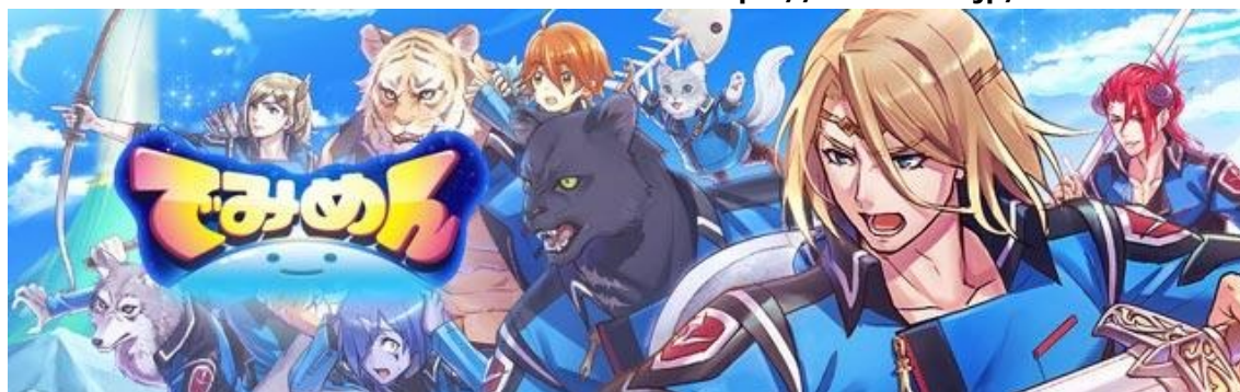
▲魔王軍をばっこぼこにする RPG『でみめん』

事前登録の参加者数に応じて、もらえるプレゼントが豪華になるキャンペーンを開始します。事前登録参加者数が増えるとゲーム内でキャラクターを仲間ができるゲーム内通貨"クリスタル"が増量。登録特典の受け取り方法はアプリリリース時にお知らせいたします。