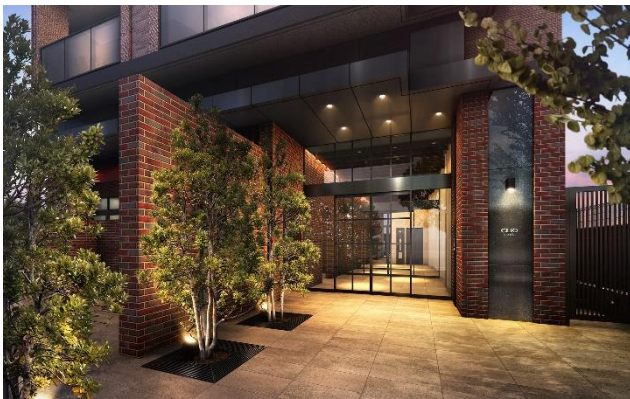
エントランスアプローチ完成予想図 (※6)