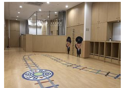
「鉄道」をイメージした園内