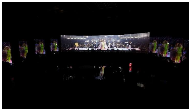
2018 SPRING/SUMMER