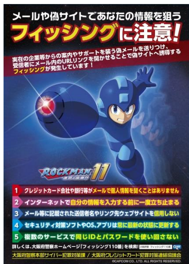
チラシのデザイン