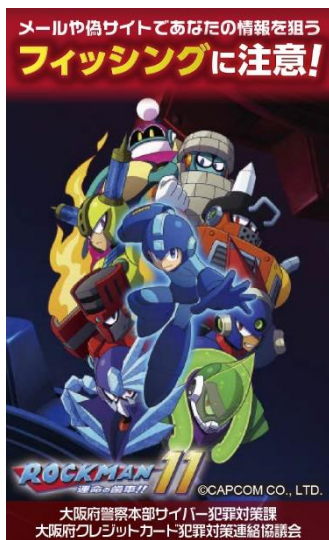
ステッカーのデザイン