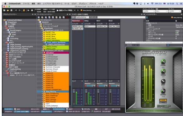
サウンドデザインモード (ミキサー)