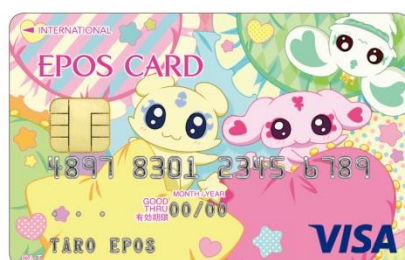
メップル・ミップル・ポレン