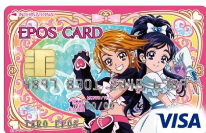
ふたりはプリキュア