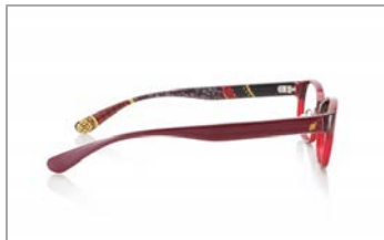
各キャラクターの象徴となるカラーを採用。

メガネの型は使いやすいウエリントンタイプとスクエアタイプをご用意。フレームは各キャラクターの象徴となるカラーを採用することで、それぞれの個性を忠実に再現。テンプル（メガネのつる）エンドには、キャラクターの紋をあしらうなど細部にまでこだわりました。巻物状にデザインされた特製のオリジナルケースと専用のセリートも必見です。