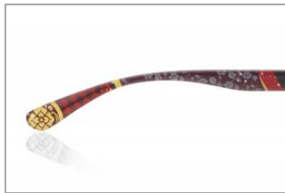
テンプルエンドには、それぞれの紋を配置。