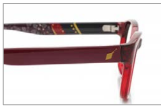
忠実に再現するために細部までこだわりを。