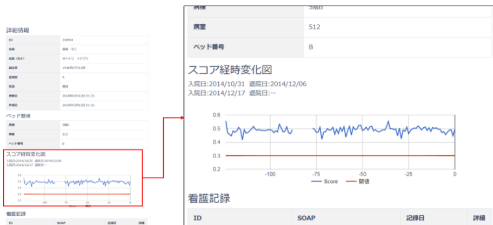
(図表②：実証実験版デモ画面より)

転倒転落リスクの高い患者のスコア表示画面。変化するリスクレベルを時間の推移とともに確認可能（イメージ）。