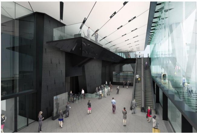
エントランスホール内部のイメージ

なお、当ビルの14～18階の5フロアには当社をはじめ、プリンスホテル、西武プロパティーズのグループ3社の入居が決定しています。事業環境の大きな変化が想定されるなか、社会・経済の変化を敏感にとらえ、事業を機動的に展開することにより、持続的かつ力強い成長の実現を目指します。