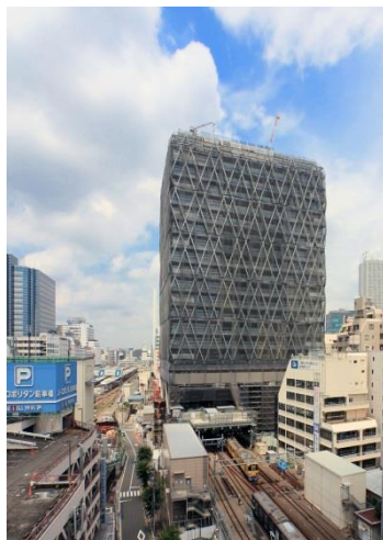
ビルのゲート部分を電車が通過する（2018年7月撮影）