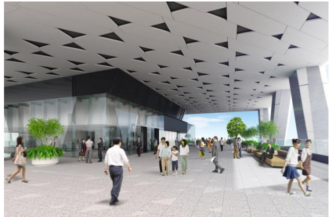
ビル内デッキのイメージ（池袋方面より南側を臨む）