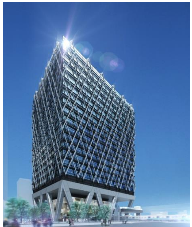
完成イメージ（明治通り方面より）

池袋の新たなランドマークに相応しい建物名称として、鉄道の運行表であるダイヤグラムをイメージさせる特徴的な外観や、タワーボディの外殻を菱型に包む鉄骨ブレースが陽光を受ける輝きは“ダイヤ”を、当ビル最大の特徴である線路を跨いで建ち、電車が建物の下をくぐり抜ける様子を“ゲート”で表現しています。西武鉄道をご利用いただくお客さまを池袋に迎え入れ、送り出すゲートとしてあり続け、また、西武グループの拓かれた未来への入り口となるよう想いを込めています。