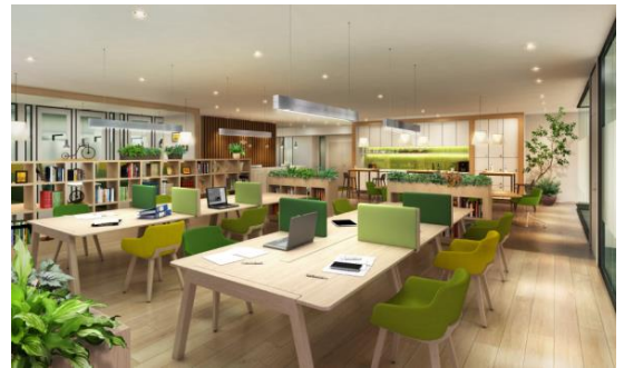
コワーキングスペースのイメージ（リージャス・グループ）