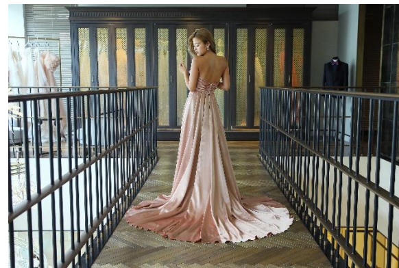
〈5回目：最終フィッティング〉