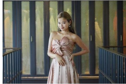
〈フルオーダーメイドドレス イメージ〉