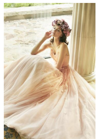
< MM BY YUKO NOGAMI >