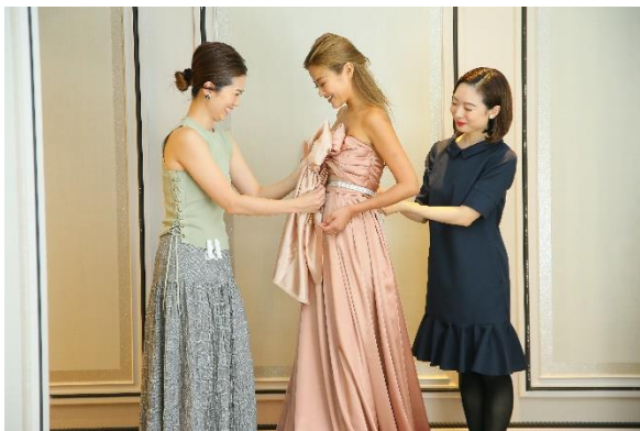
〈4回目：トワルチェック〉