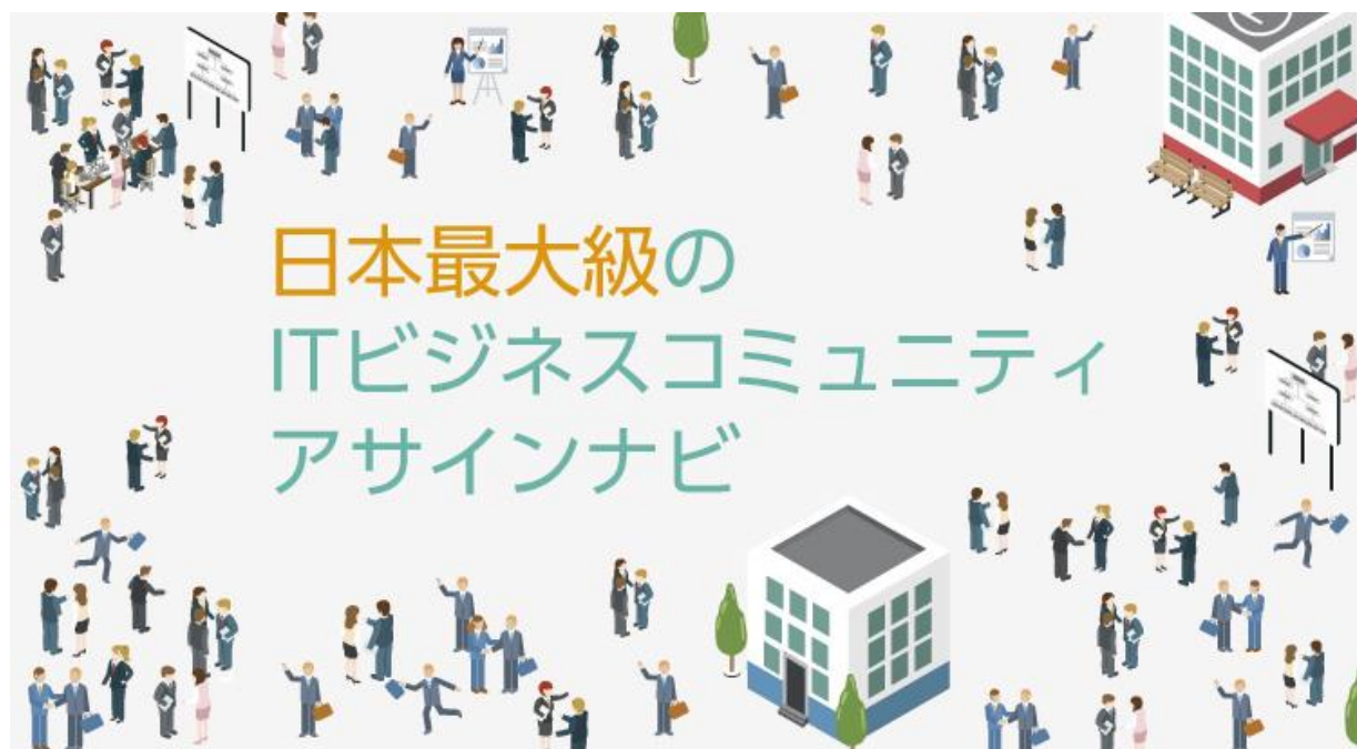
▲日本最大級の IT ビジネスコミュニティ アサインナビ

「アサインナビ」( https://assign-navi.jp/ )をコンサル／IT 業界のコラボレーションを加速する「プラットフォーム」として育てることで、業界全体がよりよくなることに貢献していきます。アサインナビを今後とも宜しくお願いいたします。