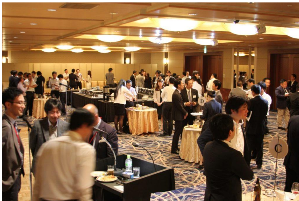
▲2017 年実施の様子：毎年、赤坂 ANA インターコンチネンタルで開催しております。

過去開催時には、すぐに契約につながった企業の方もいらっしゃいます。多くの方からご好評いただいているイベントとなっております。経営層の方同士が直接出会うことで中長期的な関係を結べる機会となっております。