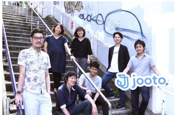
(写真)株式会社 PR TIMES の Jooto 事業本部メンバーと UI/UX デザインを担当した株式会社グッドパッチのメンバー

タスク・プロジェクト管理ツール「Jooto」(ジョートー) https://www.jooto.com/