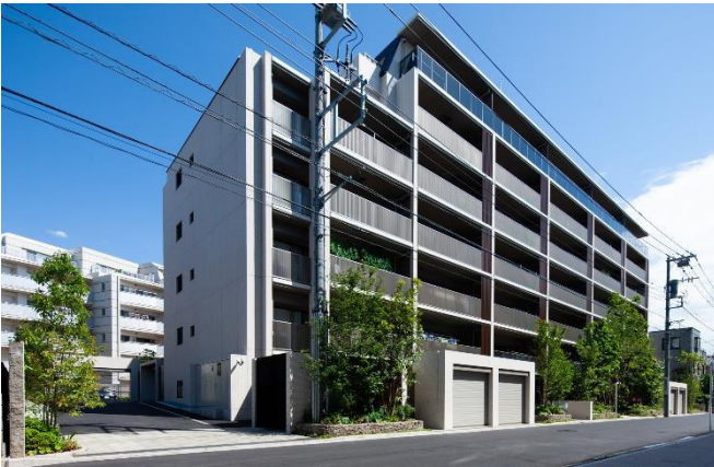
クリオ横濱綱島外観