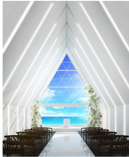
＜葵の教会(あおいのきょうかい)＞

沖縄本島からさらに南西 300km 離れた宮古島。サンゴが隆起してできた島々には人々を魅了する透明の天然ビーチが広がります。その島の南岸、海岸線に沿って広がる約 100 万坪の敷地に日常のすべてから解放されるリゾートステイの楽園・シギリリゾート。