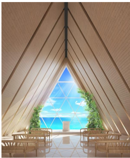
＜奏の教会(かなでのきょうかい)＞

（特設サイト URL： https://www.arluis.com/fair/miyako_lp/ ）