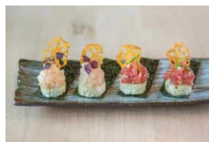
近海マグロとコナ産カンパチ のボキ寿司 ($12)