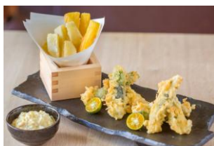
ヤシの新芽の天ぷら ($11)