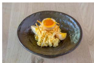
燻製ローカルエッグの ポテトサラダ ($7)