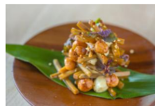
マカデミアナッツときんぴら ゴボウ マンゴークリームチーズ ($6.5)