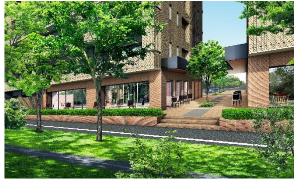
オープンテラス完成予想 CG (※1)