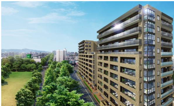
南東側外観と白石東冒険公園 CG (※1)

公園に隣接する希少な立地に 2LDK～4LDK、55.19㎡～90.71㎡の全 20 タイプ、103 邸を計画しています。