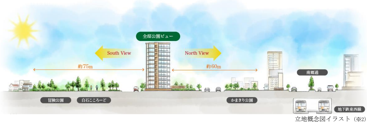
立地概念図イラスト (※2)

※1：完成予想 CG は設計段階の図面を基に描き起こした外観 CG に、2017 年 10 月に撮影した写真を合成したもので、形状・色等は実際とは異なります。外観及び内観形状の細部、設備機器等は表現していません。表現されている植栽は計画段階のものであり、変更になる場合がございます。また葉の色合いや枝振りや樹形は想定であり、竣工から生育期間を経た状態のものを描いています。また特定の季節状態を示すものではありません。