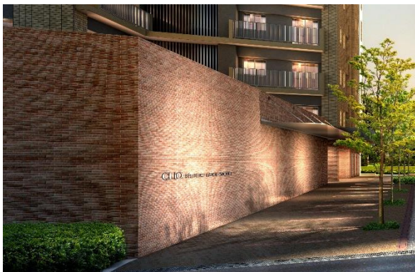
ウエルカムウォール完成予想CG（※1）

「クリオ レジダンス南郷緑邸」は地下鉄駅至近でありながら緑あふれる2つの公園に囲まれた希少立地に建つ「ウエスト」「イースト」の2棟からなる全20タイプ、103戸の大型プロジェクトです。2つの公園を結ぶように計画したアプローチには北海道開拓の歴史をイメージしたレンガタイル調のウエルカムウォールを配置し、各棟のエントランスホールを繋ぐオープンラウンジが公園の緑に面したカフェのような空間を演出しています。公園ライフを満喫できる「専用テラス付き住戸」や「ロフト付住戸」「ルーフバルコニー付住戸」など特徴的なプランをご用意しました。